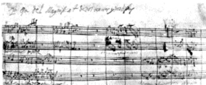
Segona pàgina del manuscrit del Magnificat (1700). Arxiu Capítular de València.

Segons afirmen Della Corte y Guido Pannain en la seua Història de la Música podem dir que Cabanilles és el geni per antonomàsia de la música espanyola per a orgue. En ell trobem en síntesi, el procés de l'evolució de la música organística hispànica. Les seues obres fan palés un profundíssim ingeni en l'art de la variació i del contrapunt, com també al revolucionari de l'harmonia coetània.